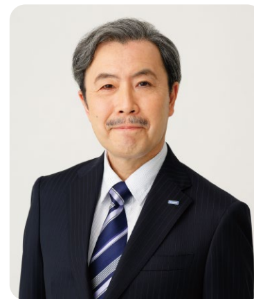
株式会社 小学館集英社プロダクション 代表取締役社長

体験し、夢中になり、やがて本当の「好き」になる――このサイクルを通して、世界中の人たちの幸福を作り続けていきたいと心から願っています。