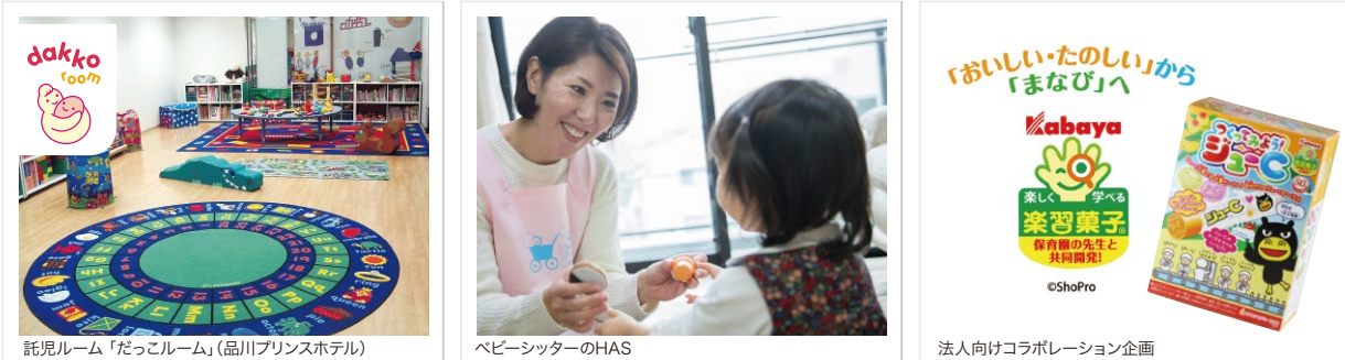
託児ルーム「だっこルーム」(品川プリンスホテル)